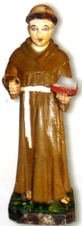
සරල ගොඩනැගිල්ල තුළ වූ අල්තාරය මත දෙරටේ කතෝලික ප්‍රජාවගේ අතිමහත් භක්තියට

හා විශ්වාසයට බඳුන් වී ඇති ඓතිහාසික ශුද්ධ වූ අන්තෝනි මුණිදුන්ගේ කුඩා ප්‍රතිමාව තැන්පත් කර ඇත. වර්ෂ 1974දී දෙරටේ රාජ්‍ය නායකයින් අතර ඇතිකර ගත් 'සුභද ද්වී පාර්ශ්වික' ගිවිසුමක් මගින් කවච්චි දූපතේ අයිතිය ශ්‍රී ලංකාවට පැවරුවත් ඉන්දියානුවන්ගේ පාරම්පරික ධීවර අයිතිවාසිකම් හා ආගමික නිදහස තහවුරු කර ඇති අතර අදද දහස් සංඛ්‍යාත ඉන්දියානු හා ශ්‍රී ලාංකික බැතිමතුන්ගේ සහභාගිත්වයෙන් එහි වාර්ෂික මංගල්‍යය පවත්වති.